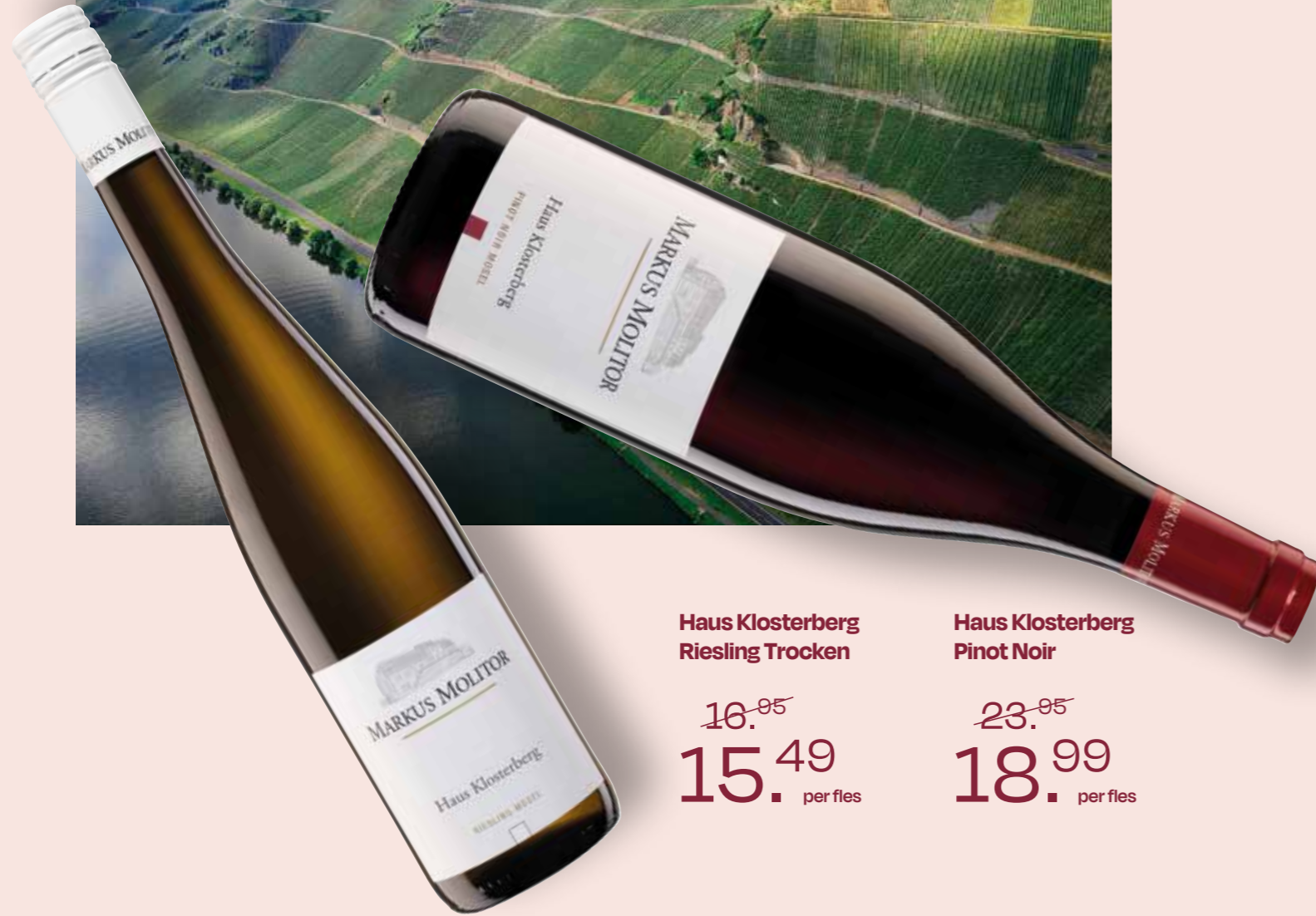
Haus Klosterberg Riesling Trocken