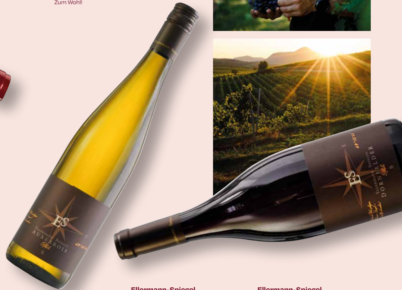
Ellermann-Spiegel Auxerrois Trocken